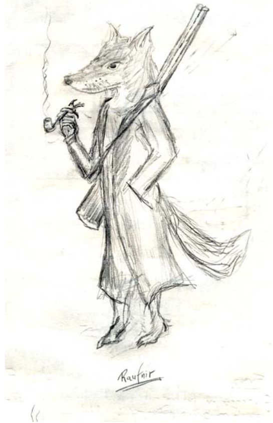
Raufnir vid löningsdags

Man lyckas snart komma fram till Mos Mosel där man övernattar. Nästkommande dag färdas äventyrarna vidare på nyinköpta hästar i sällskap med Jerry Gaxy. Från Svartstena går färden ombord på Gyllene Spiran som styrs av kapten Gyllenskägg. Ombord spelar Styrbjörn bort mycket pengar innan han kryper till kojs.